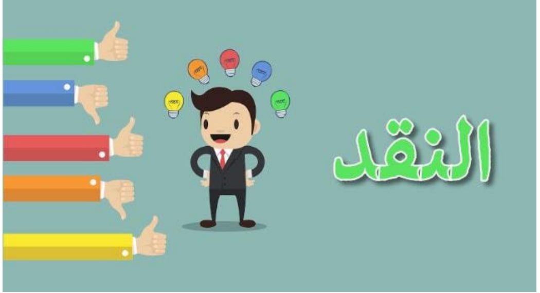
إجراء نقد بحث علمي

يُعدُّ نموذج نقد بحث علمي بهدف التعرف على أوجه القصور في جميع إجراءات الأبحاث أو الرسائل العلمية، وكل خطوة لها قواعد النقد المرتبطة بها، والهدف من ذلك زيادة خبرات ومهارات الباحثين في تنفيذ موضوعات دراسية متنوعة، والتعرف على مواطن الضعف والقوة، ومن ثم نسج رسائل وأبحاث ذات جودة عالية في المستقبل، وكذلك صياغة ونشر أوراق علمية.