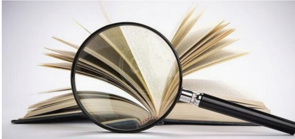
الأسلوب العلمي في النقد

يحتاج الإيضاح من الناقد، دراسة الموضوع دراسة عميقة، حتى يتمكن من عرض الأفكار والتعبير عنها بأسلوب واضح.